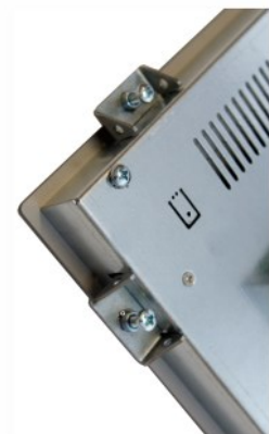
Klemmwinkel zur Einbaumontage