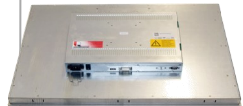
Rückseite mit Elektronikabdeckung